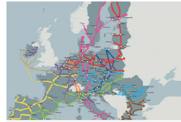
Trans-European transport network (TEN-T)

https://italy.representation.ec.europa.eu/notizie-ed-eventi/notizie/lue-investe-62-miliardi-di-eu-infrastrutture-di-transporto-efficienti-sicure-e-sostenibili-2023-06-22_it (Rappresentanza in Italia Commissione europea)