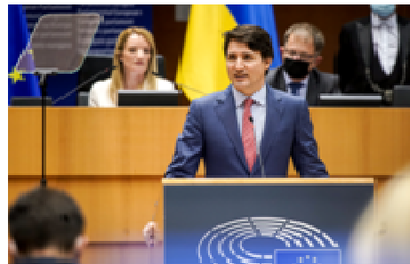
Justin Trudeau © European Union, 2022 - Source: EP

https://www.europarl.europa.eu/news/it/press-room/20220322IPR25935/justin-trudeau-momento-decisivo-per-il-canada-l-ue-e-i-nostri-partner (Parlamento Europeo)